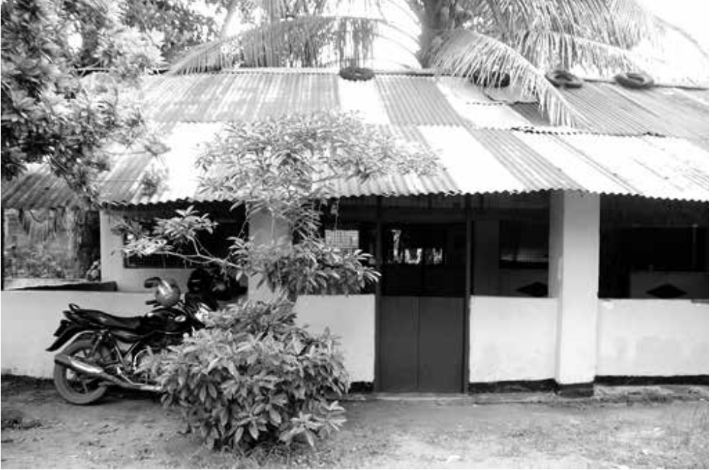
ගලේ බණ්ඩාරගේ මව වෙනුවෙන් ඉදි කළ දේවස්ථානය