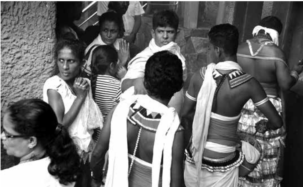
ප්‍රධාන කපුරාලගේ කන්තලව්ව