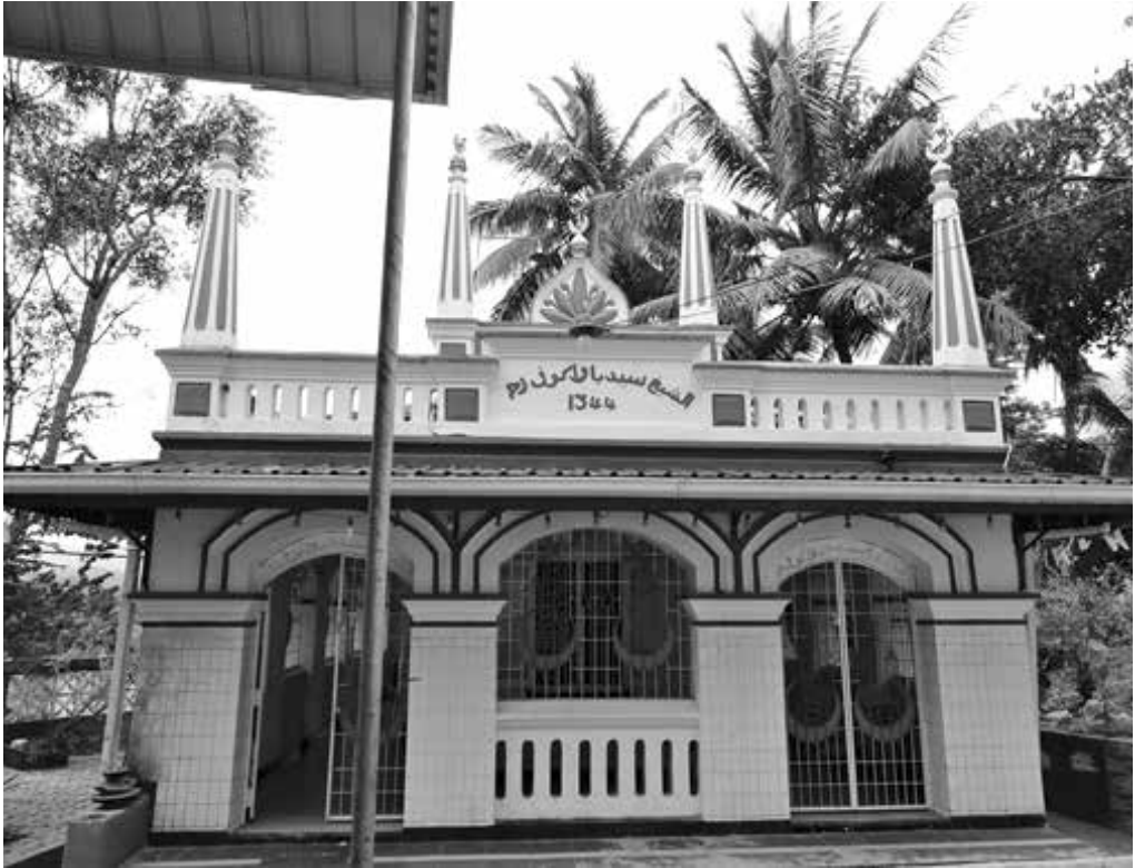
කහට්ටිය පූර් දේවස්ථානය