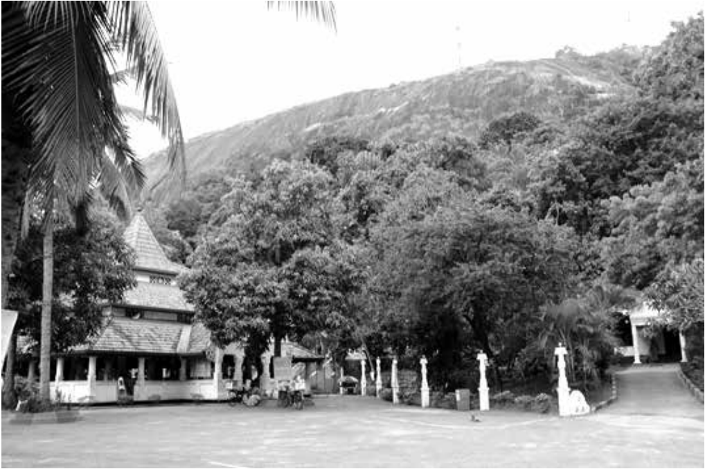
ඇතුගල රාජ මහා විහාරය