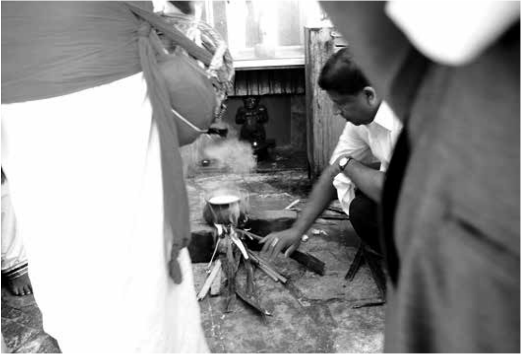
ප්‍රධාන යාතුකර්මයේ කොටසක් ලෙස කිරි ඉතිරවීම