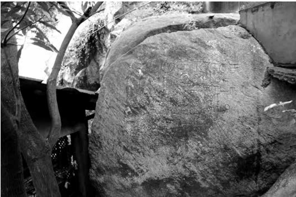
ගලේබණ්ඩාර ඉස්ලාම් දේවස්ථානය අසල ඇති දෙමළ සෙල්ලිපිය