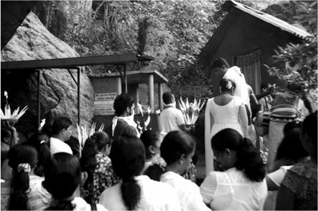
දේවාලයට එන වැඩි දෙනා කාන්තාවන්