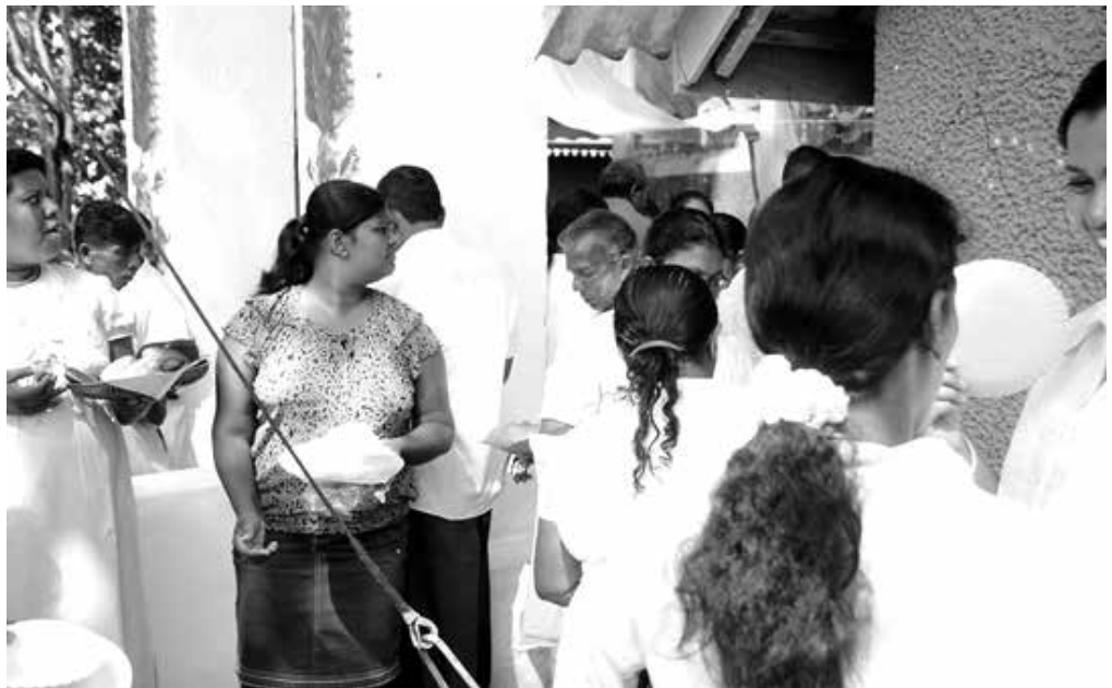
බැතිමතුන් අඩුක්කු ආහාරයට ගැනීම