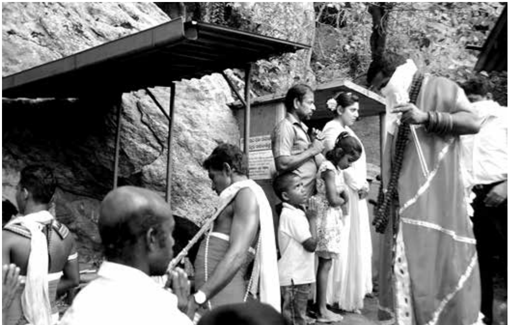
දේවාලයේ ප්‍රධාන කපු මහතා සාම්ප්‍රදායික ඇඳුමින් සැරසී