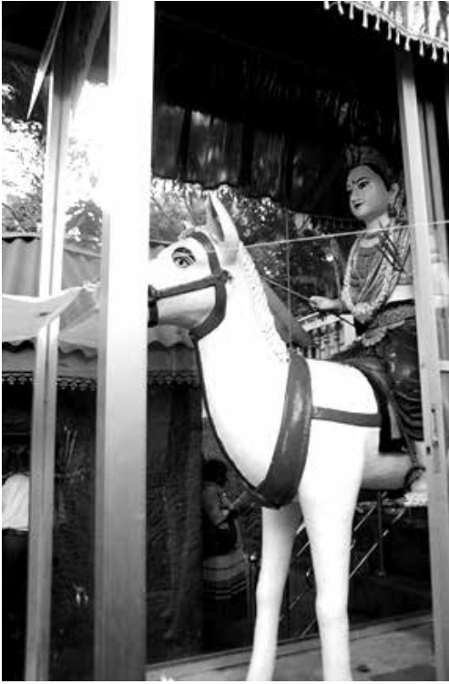
අසුපිට නැගී ගලේබණ්ඩාර පිළිරුව