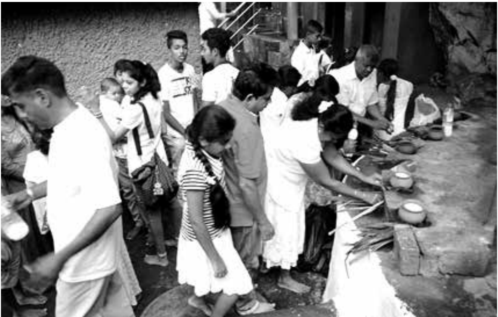
කිරි ඉතිරවීමේ මංගල්‍යය