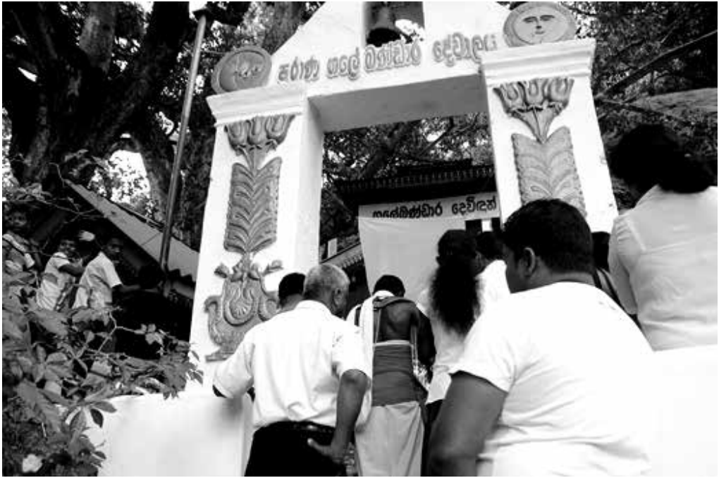
බෞද්ධ ගලේඛණ්ඩාර දේවාලයේ පිවිසුම